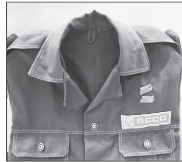
Куртка бойца стройотряда

В конце своего небольшого повествования хранитель фондов подчеркнул, что о возведении главного корпуса осталось много воспоминаний. Такие экспонаты покоятся на полках нескольких стендов. Но именно куртка члена студенческого строительного